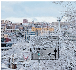
NEVE Si teme l'arrivo