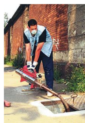
Disinfestazione di zanzare

L UOGO e orario della puntura. Attraverso una app i baresi potranno mappare la presenza di zanzare in città per consentire interventi di disinfestazione mirati. Si chiama Zanza-Mapp l'applicazione per telefonini realizzata dall'Università Sapienza di Roma e promossa dal Comune di Bari: uno strumento veloce per individuare le zone in cui le zanzare creano più disagio. «È un progetto innovativo per monitorare la diffusione delle zanzare sul territorio -