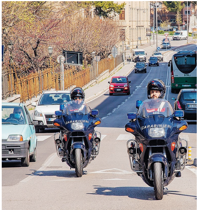
CARABINIERI Pattuglie anche sulle moto