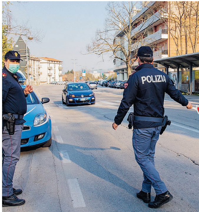
POLIZIA Automobilisti fermati a Potenza