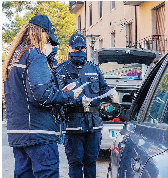
POLIZIA LOCALE Il «test» delle autocertificazioni

FESTIVITÀ IL REGALO AI BAMBINI DELLE CASE FAMIGLIA E AGLI ANZIANI OSPITI DELLE CASE DI RIPOSO