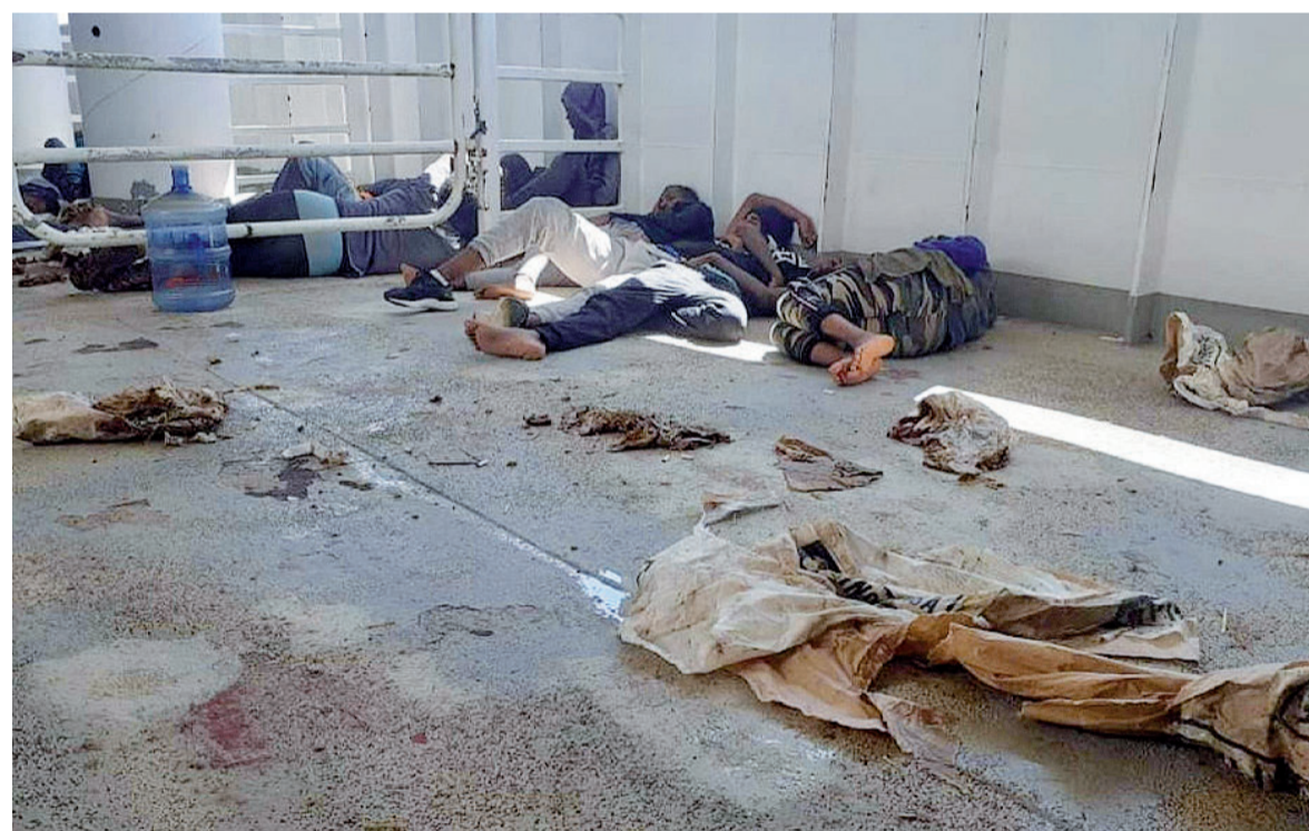
Migranti a bordo della Talia, la nave bestiame che li ha soccorsi settimana scorsa. Il negoziato con Malta si è concluso ieri, con lo sbarco dei profughi sull'isola

Durante la quarantena, molti ragazzi non hanno lavorato e sono diventati bersaglio facile di faccendieri e approfittatori. «Non hai soldi? Ti presento io chi te li presta. Un usuraio, ovviamente. Non era mai successo»