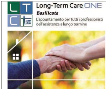
La locandina dell'evento

Rivolto ai professionisti e ai decision maker del mondo dell'assistenza sanitaria e del welfare, così come alle istituzioni, l'appuntamento in programma nella città dei Sassi, farà il punto su come adeguare l'approccio terapeutico a un insieme sempre più ampio di malattie di natura cronica e direttamente correlate all'invecchiamento.